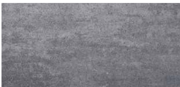
Nuance Light Grey*